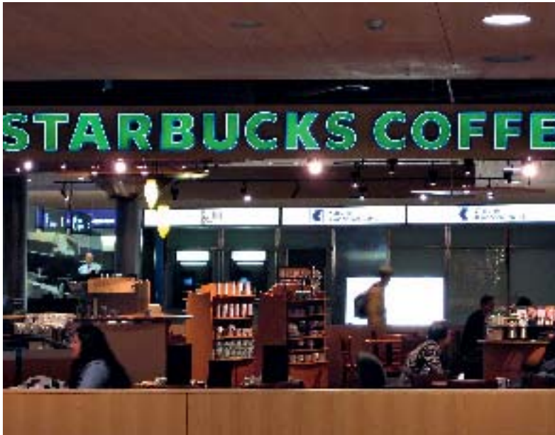
Jetzt fair gehandelt: Kaffee von Starbucks.